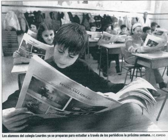
Los alumnos del colegio Lourdes ya se preparan para estudiar a través de los periódicos la próxima semana.

Además, el colegio de Nuestra Señora de Lourdes pretende que los escolares de Infantil y Primaria, a quienes va dirigida la actividad, aprendan a expresar libremente su opinión, debatir en grupo sus problemas, publicar sus propios periódicos y, que en definitiva, tengan acceso a los medios de comunicación.