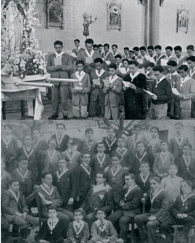
Foto superior: Consagración de los congregantes en la capilla. Foto inferior: Congregantes de la Inmaculada en 1908.