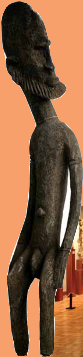
dogón, Mali, ancestro, finales del s.XX, madera, colección particular

Una parte importante de las obras expuestas corresponden al África occidental, lo que permite analizar las influencias comunes. Al margen de este núcleo geográfico, también se pueden contemplar otras figuras del centro y este del continente, que pueden ampliar la curiosidad del espectador.