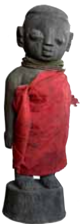
fon, Benin, fetiche, finales del XX, madera, colección particular